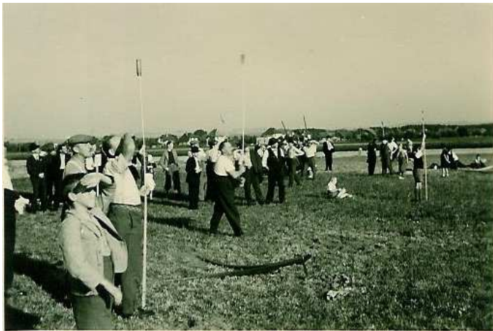
Das git ä Länge