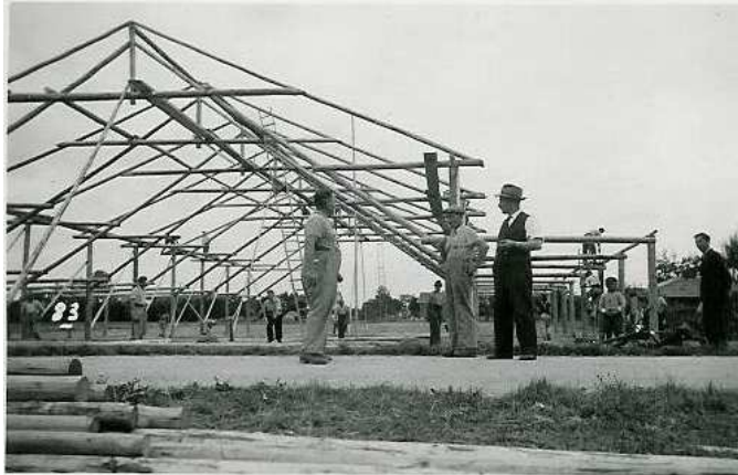
Festhütte im Rohbau

Am 15. August wurde der Eidg. Hornussertag von den Hornussergesellschaften Obergerlafingen und Ziebach durchgeführt, was ausserordentlich erfolgreich ablief. Weniger Erfolg bescherte dann der Wettkampf.