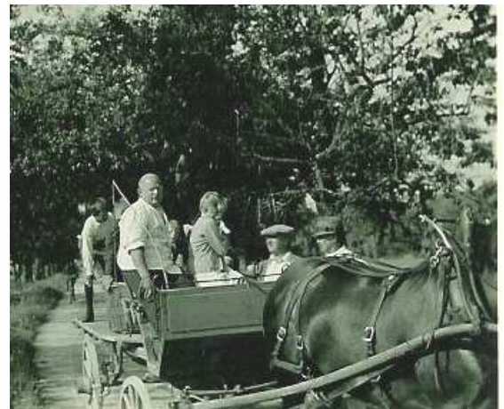
Die Würste von Von Arx