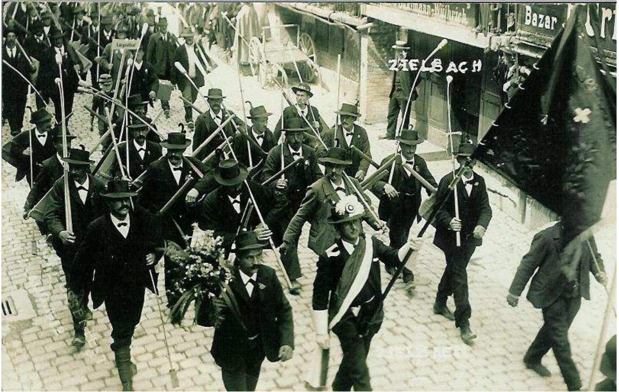
Festumzug durch Solothurn

Im weitem wurden noch an der Fahnenweihe in Gerlafingen, am Hornussertag in Burgdorf und am Pfeffermatch in Burgdorf teilgenommen.