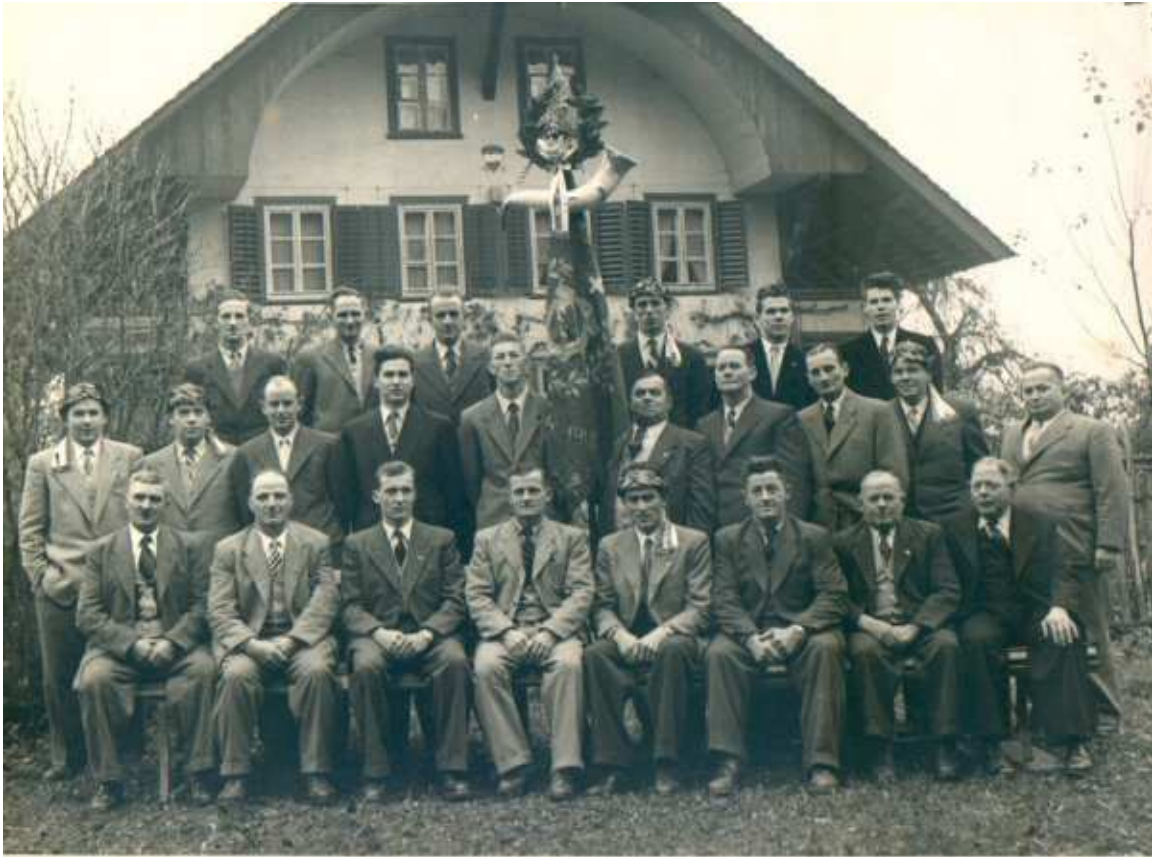
Schwing- und Älplerfest Winterthur: 1. Rang 0 Nr. 1288 P.

Eine Woche später wurde am Solothurner Kant. Hornusserfest teilgenommen. Es schaute der 6. Rang heraus, fünf erkämpften sich den Eichenkranz.